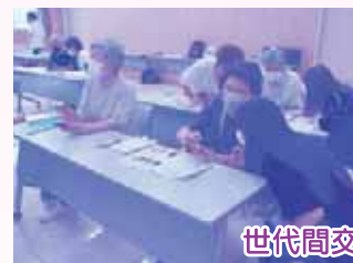
世代間交流会の様子