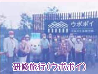
研修旅行(ウボポイ)