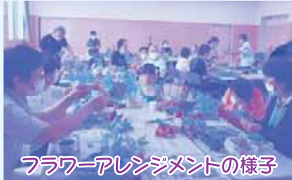
フラワーアレンジメントの様子

9月9日は、月形産の花を使った「フラワーアレンジメント」と「お楽しみ抽選会」を行いました。当日は、メイン会場と高齢者施設をオンラインで繋ぎ、児童、高齢者、障がいを持つ方など総勢56名が参加。花の魅力に触れ、思い思いの素敵な作品が完成しました。ご参加ありがとうございました。