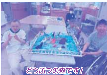
どうぶつの森です!

むう～んでは、「みんなあーと2023」と「いわみざわハート&アート2023」へ向け毎日コツコツと取り組んできました。最終段階に入り細やかな作業には「面倒くさいな～」というような声が何度か聞かれましたが、最後は気合で頑張りました。かなりの力作揃いです。