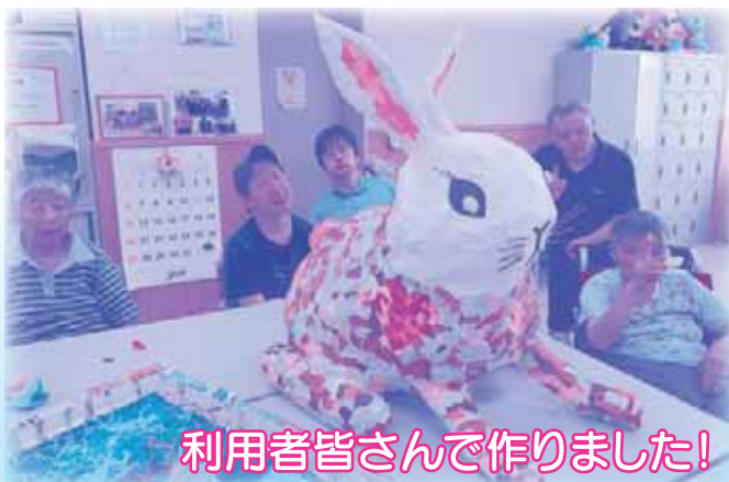
利用者皆さんで作りました!