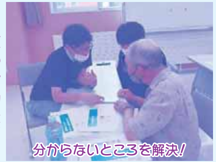
分からないところを解決!

8月3日に、昨年に引き続き、高齢者に向けた「スマホ教室」を開催しました。高齢者のスマホ操作の悩みなどについて、社会福祉法人や行政職員、月形高校生の皆さんがマンツーマンで優しく、楽しく教えていただきました。最初は、操作に不安な高齢者の皆さんも、終わったころには笑顔で世間話などもしており楽しい交流会となりました。