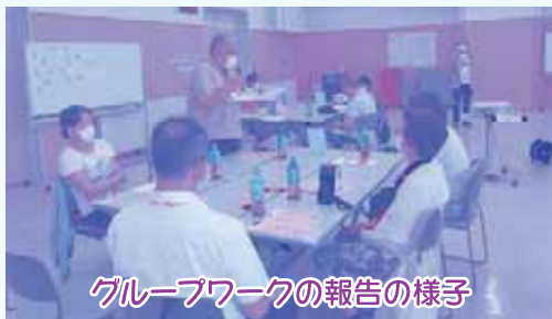
グループワークの報告の様子