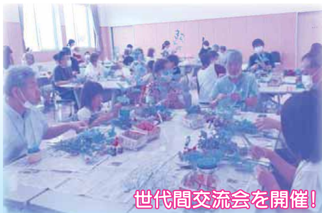
世代間交流会を開催!