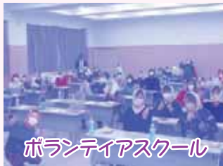
ボランティアスクール