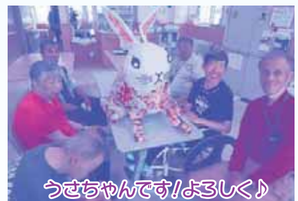
うさちゃんです!よろしく!