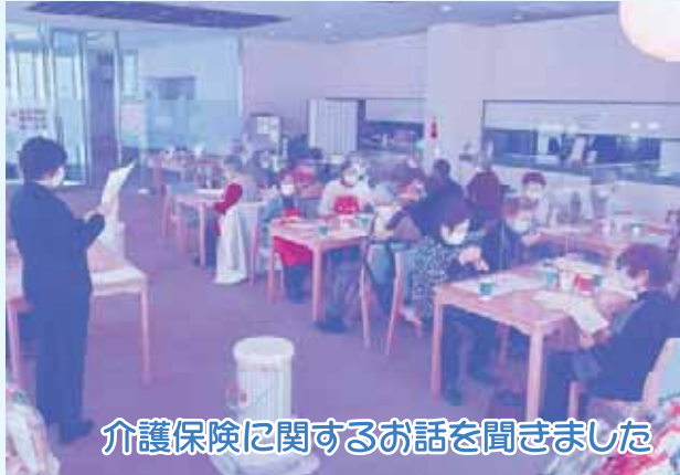
介護保険に関するお話を聞きました

今月は、参加者からリクエストの多かった、介護保険に関するお話とビンゴゲーム大会を行いました。町の地域包括支援センターの職員が来て、町内の施設に入所するための手続きや入所後の料金などの説明をいただきました。