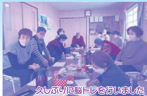
久しぶりに脳トレを行いました

脳トレが終わると春からのサロン予定を皆さんで話し合いをしています。今から楽しみです。