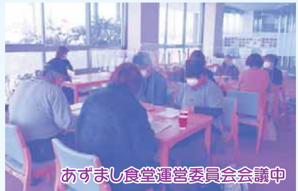
あずまし食堂運営委員会会議中

毎月第3木曜日、年10回開催しているあずまし食堂ですが、食堂運営・多世代の交流の場としてご利用していただくため、現・前ボランティアの10名で、「あずまし食堂運営委員会」を立ち上げ協議を重ねています。今年4月には、開催40回記念を迎えます。毎月楽しみにして頂ける「食の集いの場」となるように、益々、バージョンアップしていきます。お楽しみに!!