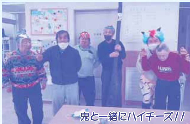
鬼と一緒にハイチーズ!!