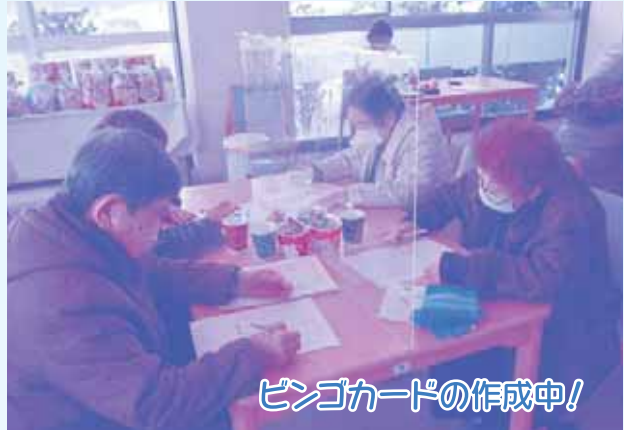
ビンゴカードの作成中!