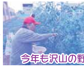
今年も沢山の野菜が実りました!

暑い夏もひと段落してきました。むう～みんなの野菜も毎日のように収穫し、一生懸命育てた野菜達を、みんなで美味しく頂きました。初めて植えたスイカも小さいながら収穫してみんなで分けて食べました。みんな笑顔で美味しいと食べていました。これから秋の収穫は、さつまいもやかぼちゃなどみんな楽しみにしています。