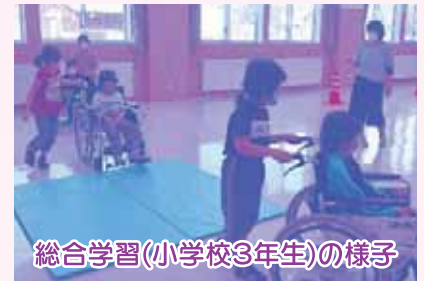
総合学習(小学校3年生)の様子

小中学生の福祉学習、ボランティア育成・研修除雪ボランティア活動等に使われました。