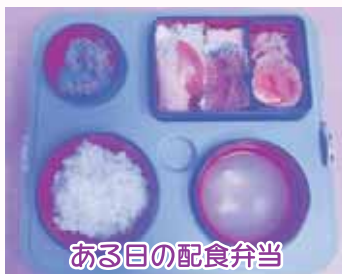
ある日の配食弁当