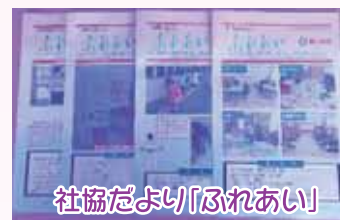
社協だより「ふれあい」