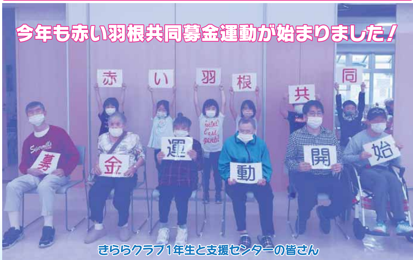
きららクラブ1年生と支援センターの皆さん