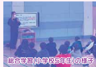
総合学習(小学校5年生)の様子