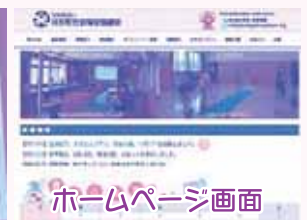
ホームページ画面