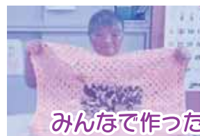
みんなで作った作品の数々です!

今年も新型コロナウイルスの影響で、みんなあと2021は中止になりましたが、いわみざわハート&アート2021には出品しています。みんなで一緒に頑張ることに意味があるので、今後も共同作業に取り組んでいきたいと思ひます。