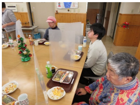
美味しい料理は個別で楽しめます！