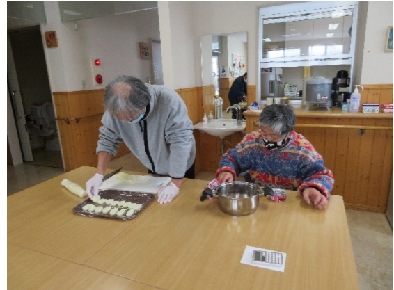
いもだんごを真剣に 1個ずつ作っています