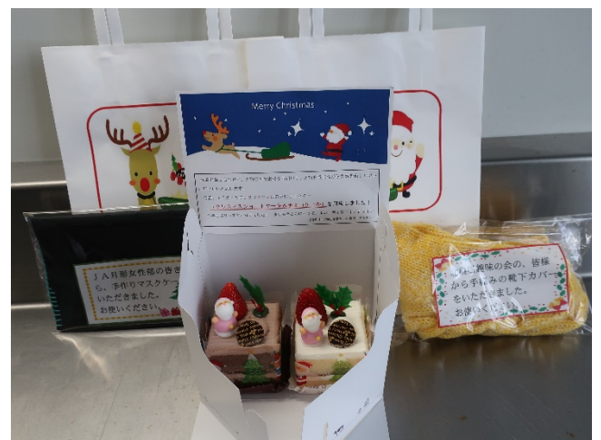
美味しいケーキ、プレゼントと盛りだくさん！

12月25日（金）は、クリスマスの日ということで、利用者の皆さんにコロナ禍で、少しでもクリスマス気分を楽しんでいただけるように、イチゴとチョコの2種類のケーキをお届け。また、JA月形女性部の皆さんから寄贈された、かわいい手作りのマスクケースと北農場趣味の会から毛糸の靴下カバーもプレゼントして、皆さんに喜んでいただくことができました。