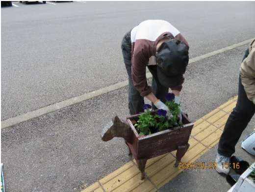
今年も交流センターが華やかに♪

5月29日(金)に今年も町から配布された花をプランターと動物プランターに植えました。この日は天気にも恵まれてみんなで一生懸命、花を植えてくれました。