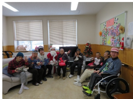
サンタさんと「はい、チーズ！」