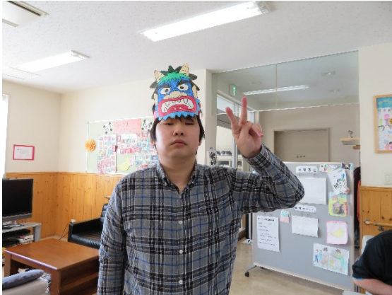
鬼のお面を被って、気合十分！

みんなで鬼のお面作りをして、豆まきを行いました。「福は内、鬼は外」と何度も豆をまいていきます。調理実習では、いも団子のお汁粉をみんなで一緒に作り、美味しくいただきました。まめまきが終わると次は、桃の節句の準備で、ひな壇飾りをみんなで組み立てた。毎年「この人形はどこに置くかな」と考えながら飾りました。