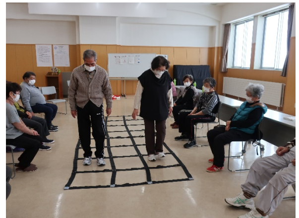
1年ぶりのふまねっと、皆さん真剣です！

広い空間を確保するため、いつもの神社社務所ではなく交流センター講堂でのサロンとなりました。冬期間の自粛も続いており、運動不足解消に「ふまねっと運動」を楽しみました。準備運動から始めていくと、体がポカポカに温まりうっすらと汗が滲みます。身体のこりも少しほぐれたようです。当分、会食は避け、美味しいお弁当がお土産となります。