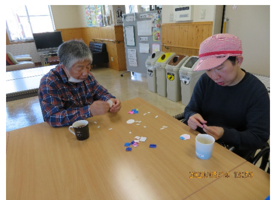
切った折り紙をあじさいの形にして 貼っていきます

シールの台紙をはがすなど細かい作業も、なんなくこなしてくれ、すてきなカードが出来上がりました♪