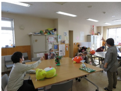
ボランティアさんが居ないので、職員とじゃんけんゲーム☆