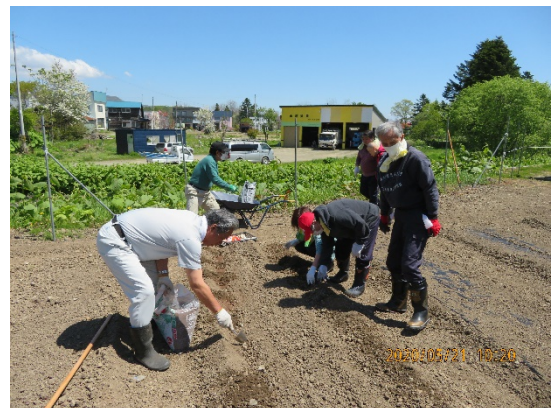
今年もたくさんの野菜ができるかな♪ 今から楽しみです！